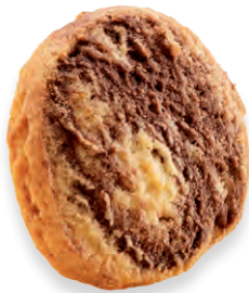
MARMORTALER Klassisches marmoriertes Mürbegebäck