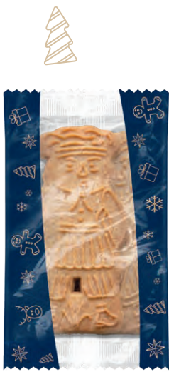
GEWÜRZ SPEKULATIUS Der würzig knusprige Traditions-Spekulatius