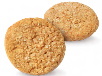
SALZ KARAMELL TALER

Mürbegebäck mit Salz und Karamellgeschmack