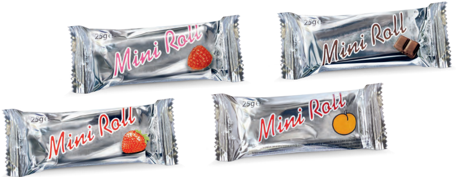
MINI ROLL ERDBEERE mit Erdbeerfüllung