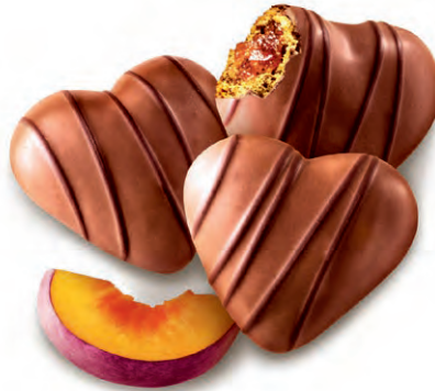
LEBKUCHENHERZEN PFLAUME Feines Lebkuchengebäck mit Pflaumenfüllung in Vollmilchschokolade