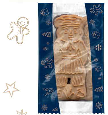
SCHOKO GEWÜRZ-SPEKULATIUS Würzig knuspriger Spekulatius mit Zartbitterschokolade