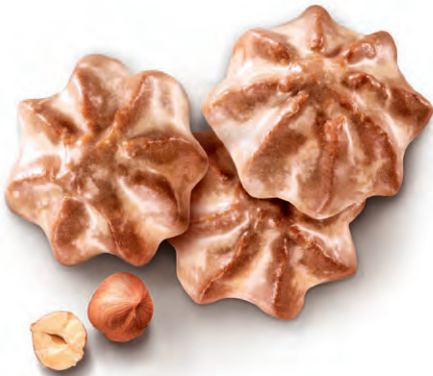
NUSS-TÖRTCHEN Saftiges Nuss-Gebäck mit feinen Haselnüssen