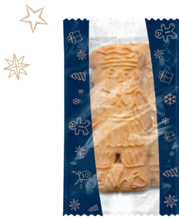
BUTTER SPEKULATIUS Zarter Spekulatius mit guter Butter gebacken