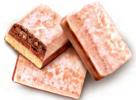
KAKAO GEWÜRZSCHNITTE Würziges Kakao-Gebäck mit Vollmilchschokolade unterzogen