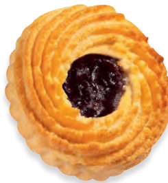
MINI-OCSENAUGEN Zartes Mürbegebäck nach Konditor-Art mit Persipan und einer erfrischenden Kirschfüllung