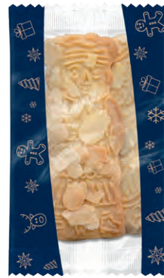
MANDEL SPEKULATIUS Zarter Spekulatius mit feinen Mandeln