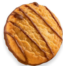
ORANGEN-TALER Zartes Mürbegebäck mit feinem Orangengeschmack, dekoriert und unterzogen von Vollmilchschokolade